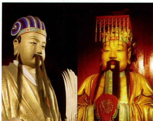
成都武侯祠内诸葛亮和刘备塑像