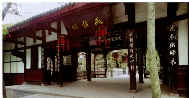
成都武侯祠过厅侧景

丹碧岿然，侯有灵，必不其飨。但祔侯帝庙，与诸文武埒，又于历代专祀之义不无舛失焉。今以前殿祀昭烈，两庑列从龙诸名臣，后殿奉侯，配以子瞻、孙尚，重死事也……自是而有门叠叠，有庑翼张，有殿有堂，前后巍煌。”金僇碑文记载：“旧制：侯祠近昭烈墓，今仍之。盖奉昭烈于正殿，侯居后，子若孙从之。殿两廊位关、张、北地王，次文武诸臣之有功者。其正大规模，遗像俨然，率皆凛凛有生气焉。”罗森碑记则说“奉昭烈正位于前殿，而左庑则祔以伏魔帝、北地王；右庑则祔以张桓侯、傅将军。堂帘以肃，如朝廷礼。特建后殿，奉武侯于中，子若孙昭穆一堂，如家庭礼。于是一代明良，与一代忠义，过庙祗谒，千秋共仰。” [8] 清代的武侯祠，包括了刘备的惠陵、汉昭烈庙等三国遗迹。庙祠内地基高、建筑面积大的前殿祀汉昭烈皇帝刘备，其相配套的左右两庑祀文武大臣；穿越过厅、地基较前殿低，建筑面积略小的后殿祀诸葛亮及子孙，左右配以钟、鼓楼和东西厢房，成相对独立祭祀区域。这样的建筑布局既不违反封建礼制，又迎合突出诸葛亮地位的民众心理。整个祠庙称“诸葛忠武侯祠堂”，成为一座中国独一无二的君臣合祀的祠庙。