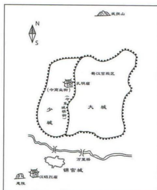
西晋末东晋初惠陵、汉昭烈庙、孔明庙位置图

成都何时武侯祠?不见正史。宋祝穆《方輿胜览》载:武侯庙“在府西北二里今为乘烟观……李雄称王始为庙于少城内,桓温平蜀,夷少城,独存孔明庙。” [3] 李雄于公元304年在成都称王,则所建孔明庙的时间应在西晋末东晋初,位置在当时的少城内,并不在今天城市西南。杜甫《蜀相》诗云:“丞相祠堂何