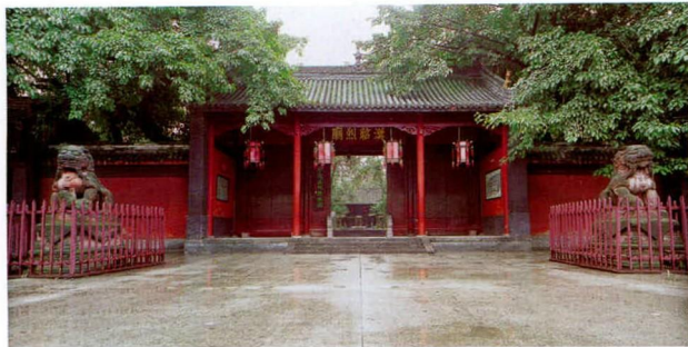
成都武侯祠大门外景