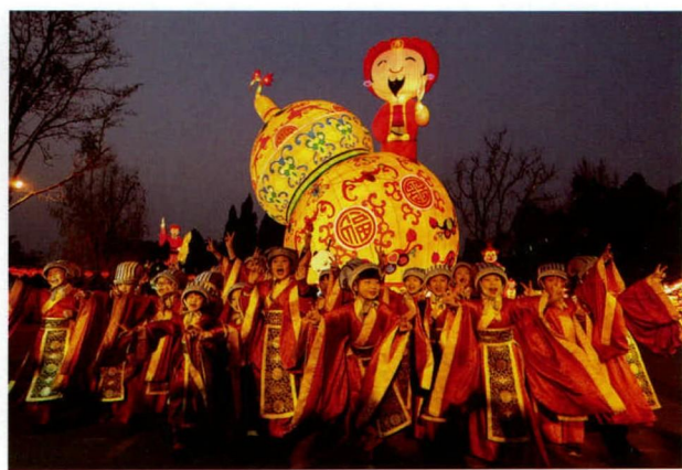
成都武侯祠博物馆2016成都大庙会三国主题灯组

城壙犹在。” [13] 故蜀汉老臣谯周说：“成都织锦既成，濯于江水，其文分明，胜于初成。他水濯之不如。” [14] 现在的锦里是原遗址区域的浓缩，它依托于武侯祠，北临锦江，东望彩虹桥；以秦汉、三国精神为灵魂，明、清风貌作外表，川西民风、民俗作内容，将历史与现代有机地融入，既扩大了三国文化的外延，又使古老的祠庙注入了新的活力。